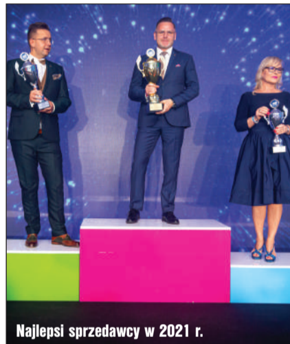
Najlepsi sprzedawcy w 2021 r.