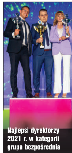
Najlepsi dyrektorzy 2021 r. w kategorii grupa bezpośrednia