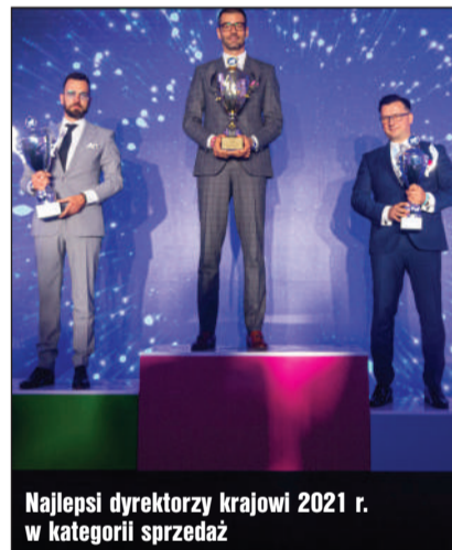
Najlepsi dyrektorzy krajowi 2021 r. w kategorii sprzedaż