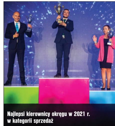
Najlepsi kierownicy okręgu w 2021 r. w kategorii sprzedaż