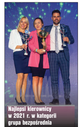
Najlepsi kierownicy w 2021 r. w kategorii grupa bezpośrednia