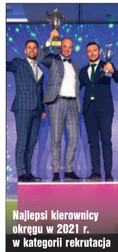
Najlepsi kierownicy okręgu w 2021 r. w kategorii rekrutacja