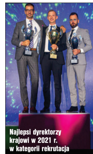
Najlepsi dyrektorzy krajowi w 2021 r. w kategorii rekrutacja