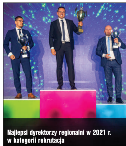
Najlepsi dyrektorzy regionalni w 2021 r. w kategorii rekrutacja