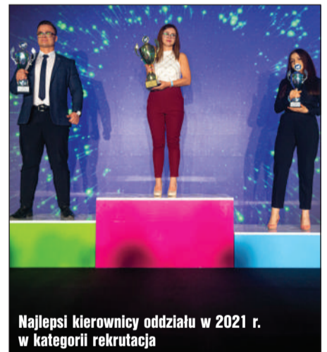
Najlepsi kierownicy oddziału w 2021 r. w kategorii rekrutacja